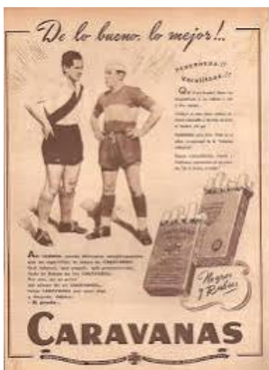
Un clásico River y Boca

La controversia se da en un contexto internacional donde crecen los reclamos para limitar este tipo de patrocinios. Días atrás, más de 160 organizaciones pidieron prohibir la publicidad de productos similares en equipos de la Fórmula 1.