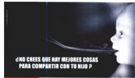
BLOQUE DE DIPUTADOS RADICALES DE LA PROVINCIA DE BUENOS AIRES FUMAR DELANTE DE UN EMBARAZO PERJUDICA A TU BEBE. "Hagamos valer la vida"

¿Cuánto habrá que esperar para que la salud pública esté por encima de los intereses económicos sectoriales?