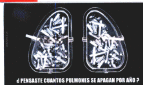
BLOQUE DE DIPUTADOS RADICALES DE LA PROVINCIA DE BUENOS AIRES FUMAR ES SUMAMENTE PERJUDICIAL PARA LA SALUD. "Hagamos valer la vida"