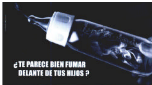
BLOQUE DE DIPUTADOS RADICALES DE LA PROVINCIA DE BUENOS AIRES EL HUMO PERJUDICA EL CRECIMIENTO DE LOS NIÑOS. "Hagamos valer la vida"

Las restantes imágenes están relacionadas con la impotencia que produce el tabaco, espacios para no fumadores y los pulmones de los fumadores.