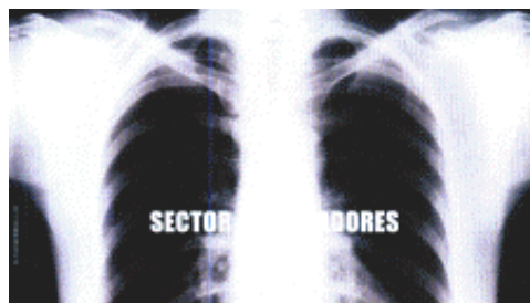
BLOQUE DE DIPUTADOS RADICALES DE LA PROVINCIA DE BUENOS AIRES EL HUMO DEL TABACO PROVOCA ENFERMEDADES EN LOS NO FUMADORES. "Hagamos valer la vida"

Con la presentación de 5 imágenes en formato de tarjetas postales y posters, el Bloque de Diputados Radicales de la Provincia de Buenos Aires ha dicho presente en todos los municipios de la Provincia. La iniciativa tiene su coherencia dado que ya hay un Proyecto de Ley con media sanción de la Cámara de Senadores y otro con origen en Diputados.