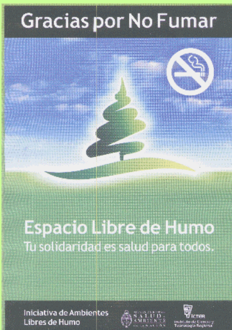
Copia de Poster distribuido por ICTER

Como se observa en este recorte del diario El Tribuno, los representantes de los productores exponen sus motivos para rechazar el Convenio Marco, y no siempre con la verdad científica o los estudios necesarios, pero si con el impacto en la comunicación o la duda en el potencial lector.